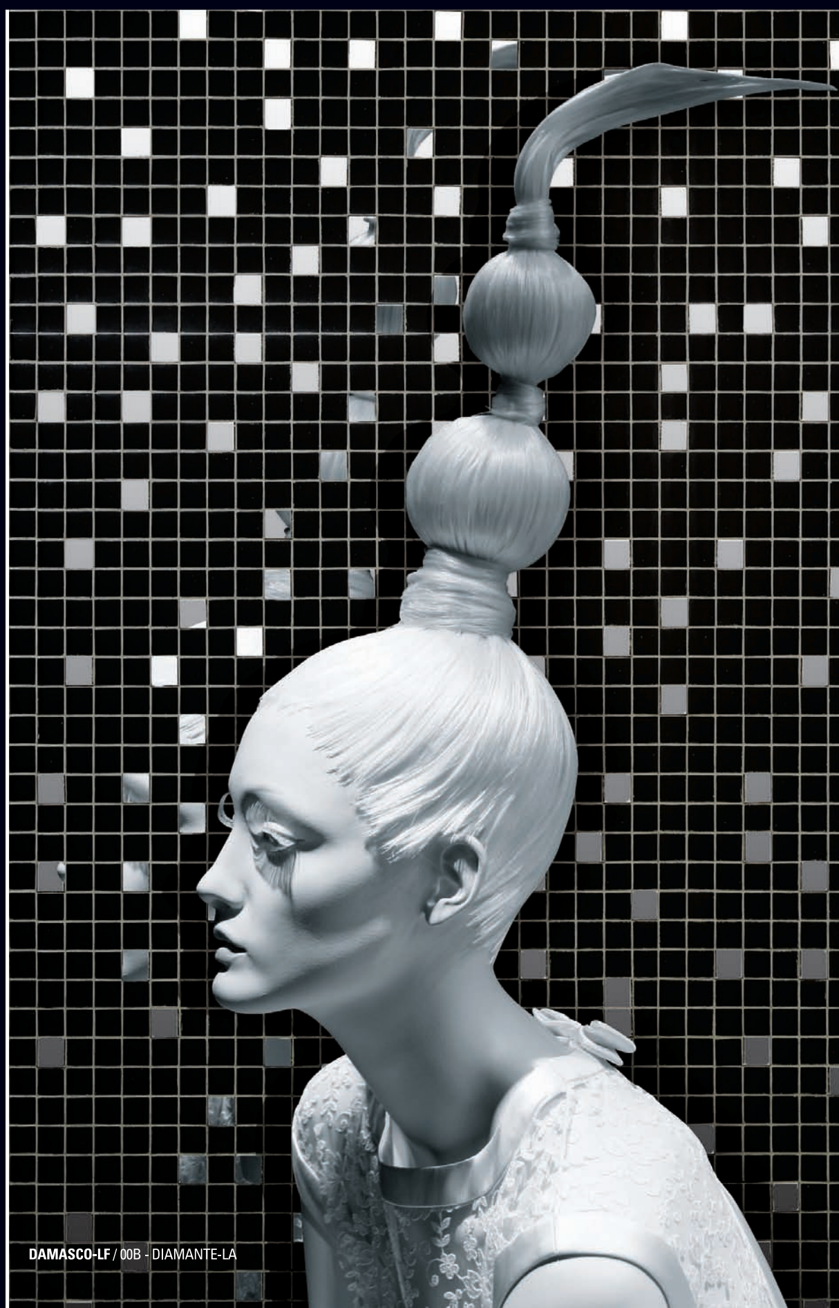
DAMASCO-LF / 00B - DIAMANTE-LA

With the possibilities of this collection, you can perform the combinations, gradations and modulars that you see in other catalogues of VITROGRES , or create your own customized decoration.